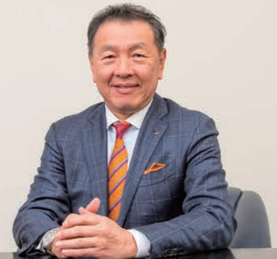
ミカサ商事株式会社 代表取締役社長