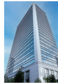
日本生命淀屋橋ビル Nippon Life Yodoyabashi Building